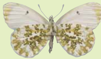
Ansicht von unten